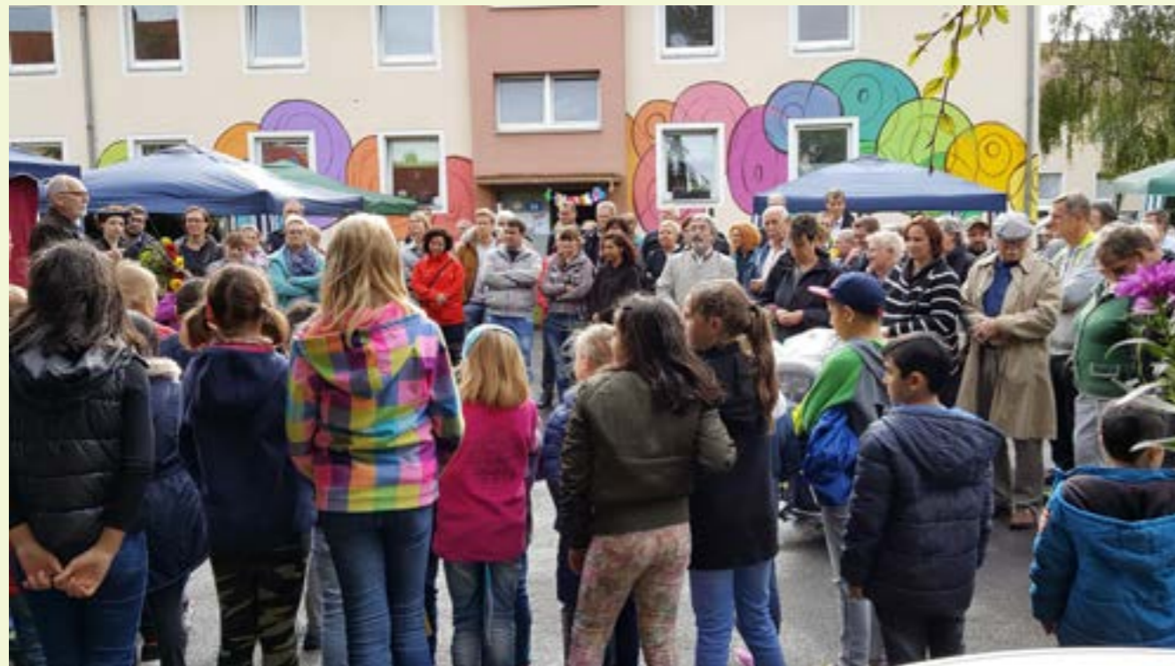
Abbildung 3: Straßenfest am Kuckuck 2017.

Ein entsprechender Förderbescheid liegt vor.