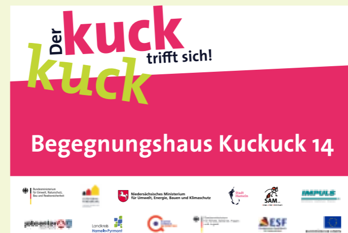
Abbildung 2: Türschild des Begegnungshauses Kuckuck 14. Darstellung: Stadt Hameln

Mit dem Kuckucksnest und dem Treffpunkt ZaK im Begegnungshaus Kuckuck 14 gibt es zwei wichtige Anlaufstellen für unterstützungsbedürftige Menschen im Quartier, die sehr gut angenommen werden. Der täglich große Zulauf insbesondere zu den Beratungsangeboten beider Einrichtungen zeigt, wie wichtig diese Angebote für die Integration der Menschen vor Ort sind. Dennoch bleibt die Vermittlung in Arbeit, Sprachkurse und Ausbildung für die Gruppe derjenigen Zuwandererinnen und Zuwanderer, die in ihren Herkunftsländern kaum Schulbildung erfahren haben, schwierig.