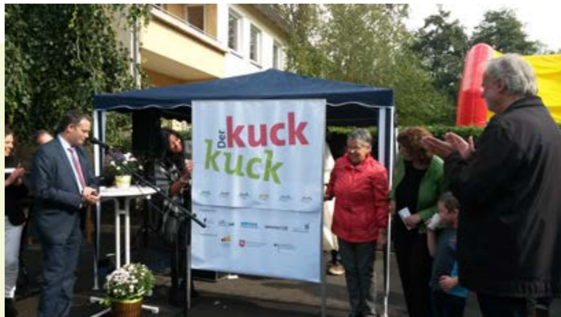
Abbildung 5: Einweihung des neuen Logos beim Straßenfest 2017.

den, wurde erreicht. Vielfältige Mitmachaktionen im Begegnungshaus Kuckuck 14 werden von den Menschen am Kuckuck zunehmend angenommen. Quartiersforen und -begehungen, Mitwirkung am städtebaulichen Planungsprozess, Mitbestimmung über einen Verfügungsfonds, gemeinsame Pflanzaktionen oder die Herausgabe einer Stadtteilzeitung bieten Möglichkeiten zur Partizipation und Identifikation. Die Zusammenarbeit am Runden Tisch hat sich im Laufe der Jahre zu einer sehr vertrauensvollen Kooperation der verschiedenen Partner entwickelt und bildet eine stabile Grundlage für die Quartiersentwicklung Kuckuck.