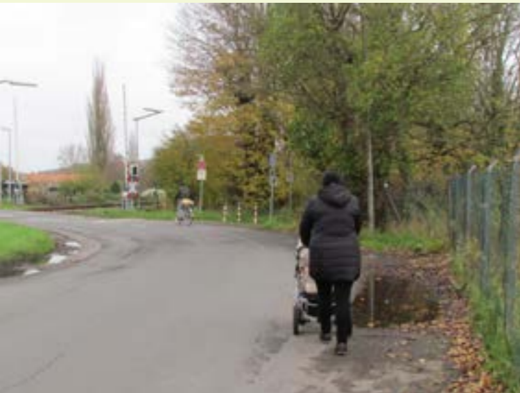
Abbildung 1: Fußwegsituation Marienthaler Straße.

Das Wohngebiet Kuckuck ist durch seine Lage zwischen den beiden Bahnstrecken Hameln-Hannover und Hameln-Hildesheim vom übrigen Stadtgebiet gewissermaßen abgeschnitten. Städtebauliche Missstände zeigen sich sowohl in der Lage und der schlechten Anbindung an die Stadt als auch im schlechten Ausbauzustand der Straßenverkehrsflächen und dem Mangel an infrastrukturellen Einrichtungen im Quartier.