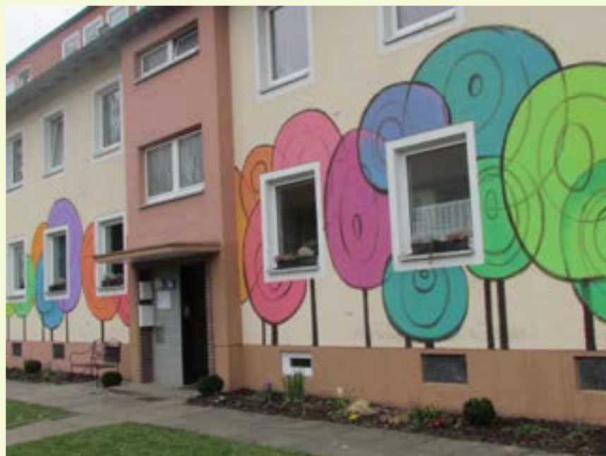
Abbildung 4: Das Begegnungshaus wurde gemeinsam mit Kindern und Jugendlichen des Quartiers verschönert.

Ergänzt werden diese bereits seit Jahren bestehenden Angebote seit März 2014 durch das Streetwork-Projekt JUGEND STÄRKEN, das sich an 12 – 26 jährige richtet und damit eine Lücke in der bisherigen Angebotsstruktur schließt. Sport-, Tanz- und Trommelprojekte für Jugendliche ergänzen jetzt das Angebot. Insbesondere im Bereich Schulverweigerung war das Projekt JUGEND STÄRKEN außerordentlich erfolgreich. Den Streetworkern ist es in kurzer Zeit gelungen, das Vertrauen der Kinder und Jugendlichen und ihrer Familien zu gewinnen und die betroffenen Kinder und Jugendlichen des Quartiers in Schulen zu vermitteln, bzw. zum regelmäßigen Schulbesuch zu motivieren.