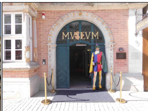
Fotos: Die prächtigen Weserrenaissancebauten und die Sage vom Rattenfänger locken viele Touristinnen und Touristen nach Hameln. Das Museum mit dem Rattenfänger vereint beides.