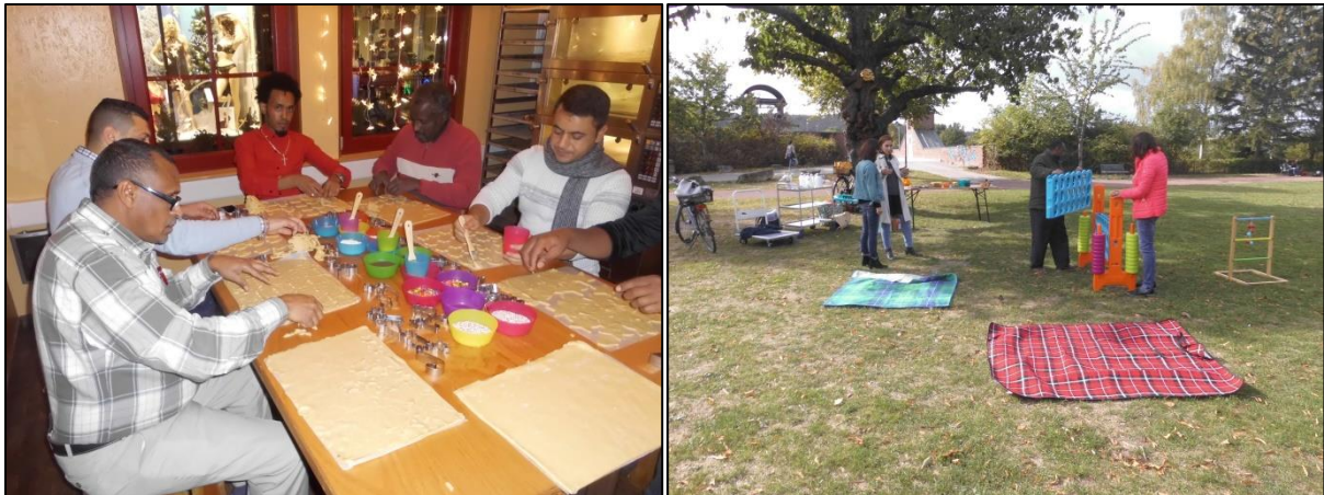
Fotos: links: Geflüchtete backen für Obdachlose; rechts: Aufbau Herbstpicknick