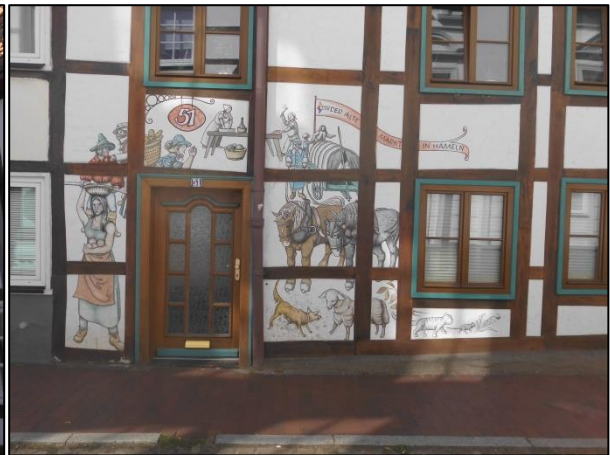
Fotos oben: links: In der Hamelner Altstadt gibt es einige stark sanierungsbedürftige Häuser, die das Stadtbild negativ prägen; rechts: In der Altstadt kommt es immer wieder zu vorübergehenden Leerständen; Fotos unten: Die vielen Fachwerkhäuser machen die Altstadt zu einem besonderen Wohnquartier.