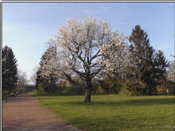
Fotos: oben links: Spielplatz In den Hofstätten; oben rechts: Spielplatz Platzstraße; unten links: ehemaliger Spielplatz Himmelreich; unten rechts: Sportanlage und Grünfläche auf dem Werder