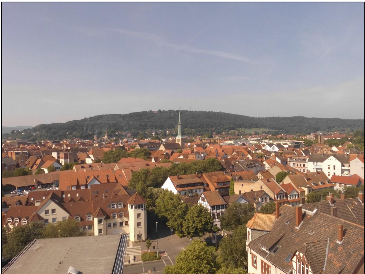
Foto: die Hamelner Altstadt vom Rathaus aus betrachtet

Die Inhalte des Integrierten Handlungskonzepts sind mit den jeweiligen Fachabteilungen der Stadt Hameln abgestimmt und vom „Altstadtgespräch“ als gemeinsame Quartiersagenda für die nächsten Jahre verabschiedet worden. Das Integrierte Handlungskonzept ist damit als „Ideenspeicher“ der sozialen Akteure und von Bewohner/innen der Altstadt und der beteiligten Fachabteilungen der Stadt Hameln zu verstehen; städtebauliche Maßnahmen und soziale Projekte greifen ineinander. Das Handlungskonzept wird bei Bedarf fortgeschrieben und ergänzt.