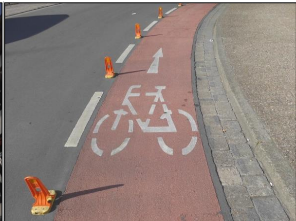
Fotos: Mehrere Einbahnstraßen wurden für Fahrräder in beide Richtungen freigegeben.